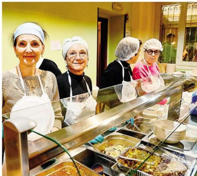
Tra le Bellezze Interiors 2024 anche la sede della mensa di solidarietà della Caritas ARCHIVIO

Una novità di Bellezze Interiors 2024 è invece l'apertura della terrazza del Novocomum, come racconta l'architetto Augusto Roda, uno dei proprietari degli appartamenti parte dell'opera di Giuseppe Terragni: